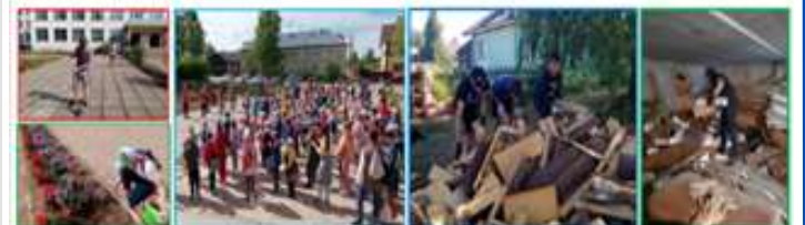
Показаны количества детей и подростков, занимающихся организованными формами отдыха, труда и занятости во время летнего каникулярного периода